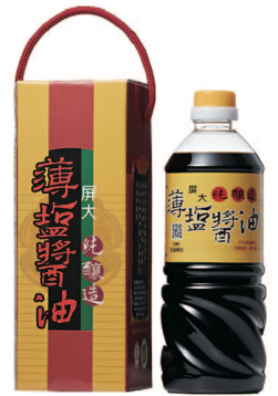
屏大薄鹽醬油 規格:710mlx1/盒 參考價:495元