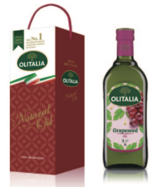
葡萄籽油 規格:1000cc/玻璃瓶 12瓶/箱 參考價650元