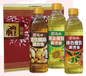
饗饌三入禮盒 G0301 花生調和油500ml+橄欖調理油500ml 葵花調理油500ml 市價：420元