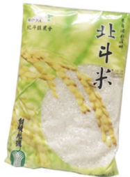
北斗米 規格：1.2公斤 等級：CNS二等米KN-1200H 市價：225元