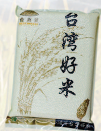
台梗11號米 規格：2、3公斤 | 等級：CNS二等米 KN-2000B/KN-3000B 市價：325元/425元

1公斤一箱16入、1.2公斤一箱16入、1.5公斤一箱14入 1.8公斤1箱12入、2公斤一箱10入、3公斤一箱6入