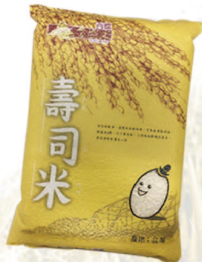
壽司米 規格：2、3公斤 等級：CNS二等米KN-2000F/KN-3000F 市價：350元/425元