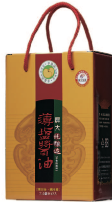
屏大薄鹽醬油 規格:710mlx2/盒 參考價:990元