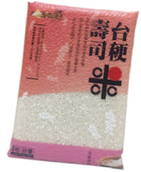
台梗壽司米 規格：1公斤 等級：CNS二等米KN-1000J 市價：200元