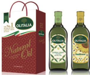
精純橄欖油+頂級葵花油 規格:1000cc*2入/玻璃瓶 6組/箱 參考價:1050元