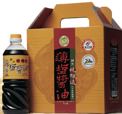
屏大薄鹽醬油 規格:710mlx6/盒 參考價:2970元

採用傳統醬油釀造方式， 經一百八十天發酵，甘醇、芳香， 未添加任何鉀鹽、焦糖色素， 不含防腐劑。