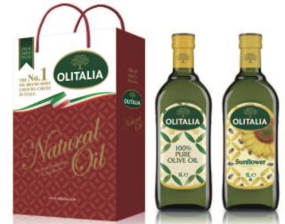
pure純橄欖油+頂級葵油 規格:1000cc*2入/玻璃瓶 6組/箱 參考價:1075元