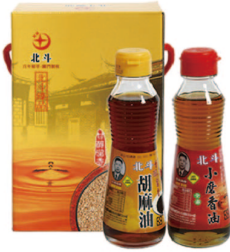
臻品小禮盒 G125-01 胡麻油125ml+小磨香油125ml 市價：235元

北斗馨油不斷引進現代化機器生產，但仍遵循古法製造，香味更獨特，品質更為精純，以最佳之品質呈現給消費大眾，以讓消費大眾使用得安心、滿意為宗旨。 *通過ISO 9001與HACP認證*