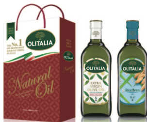
特橄欖油+玄米油 規格:1000cc*2入/玻璃瓶 6組/箱 參考價:1450元