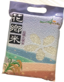
花鄉米 規格：1.2公斤 等級：CNS二等米KN-1200I 市價：225元