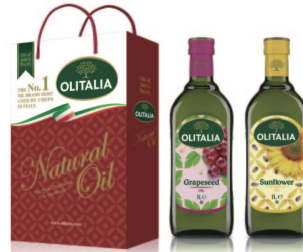
葡萄籽油+頂級葵花油 規格:1000cc*2入/玻璃瓶 6組/箱 參考價:1050