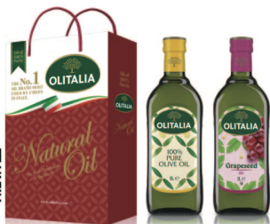
pure純橄欖油+葡萄籽油 規格:1000cc*2入/玻璃瓶 6組/箱 參考價:1325元