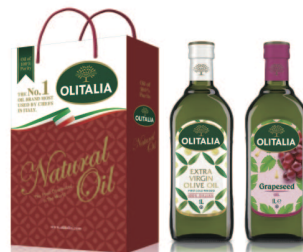
特橄欖油+葡萄籽油 規格:1000cc*2入/玻璃瓶 6組/箱 參考價:1500元