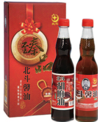
臻品中禮盒 G300-01 胡麻油300ml+馨油300ml 市價：650元