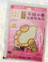
珍珠米 規格：1.8、2公斤 等級：CNS二等米 KN-1800A/KN-2000A 市價：300元/325元