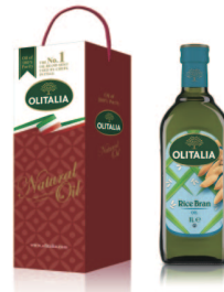
玄米油 規格:1000cc/玻璃瓶 12瓶/箱 參考價600元