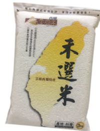
禾選米 規格：3公斤 等級：CNS二等米KN-3000E 市價：400元