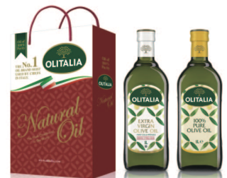
特橄欖油+pure純橄欖油 規格:1000cc*2入/玻璃瓶 6組/箱 參考價:1525元