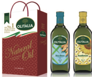
玄米油+頂級葵花油 規格:1000cc*2入/玻璃瓶 6組/箱 參考價:1000