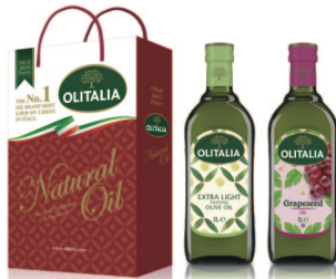
精純橄欖油+葡萄籽油 規格:1000cc*2入/玻璃瓶 6組/箱 參考價:1300元