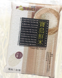
寶島鮮米 規格：2、3公斤 等級：CNS二等米KN-2000C/KN-3000C 市價：350元/425元