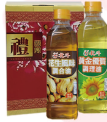
饗饌二入禮盒 G0202 花生調和油500ml+葵花調理油500ml 市價：325元