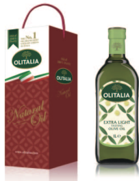
精純橄欖油 規格:1000cc/玻璃瓶 12瓶/箱 參考價650元