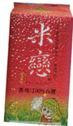
米戀 規格：500、600公克 等級：CNS二等米KN-500/KN-600 市價：125元/150元

金農米創立至今已六十餘年，從研發、生產、管理、行銷，過程中持續投入專業化設備與技術，對每粒米到每包米有著品質堅持。