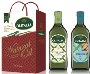
精純橄欖油+玄米油 規格:1000cc*2入/玻璃瓶 6組/箱 參考價:1250元