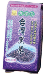
黑米 規格：600公克 等級：CNS二等米KN-0600B 市價：235元