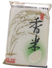
香米 規格：3公斤 等級：CNS二等米KN-3000D 市價：500元