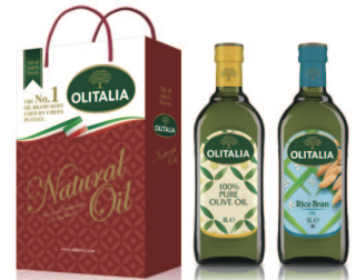
pure純橄欖油+玄米油 規格:1000cc*2入/玻璃瓶 6組/箱 參考價:1275元