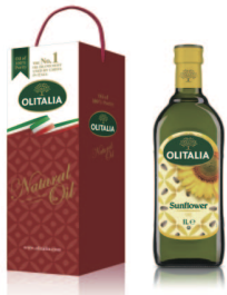
頂級葵花油 規格:1000cc/玻璃瓶 12瓶/箱 參考價400元

產品三大承諾：1. 義大利【原裝原罐】進口 2. 原廠保證100%純度 3. ISO9002認證