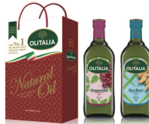
玄米油+葡萄籽油 規格:1000cc*2入/玻璃瓶 6組/箱 參考價:1250元